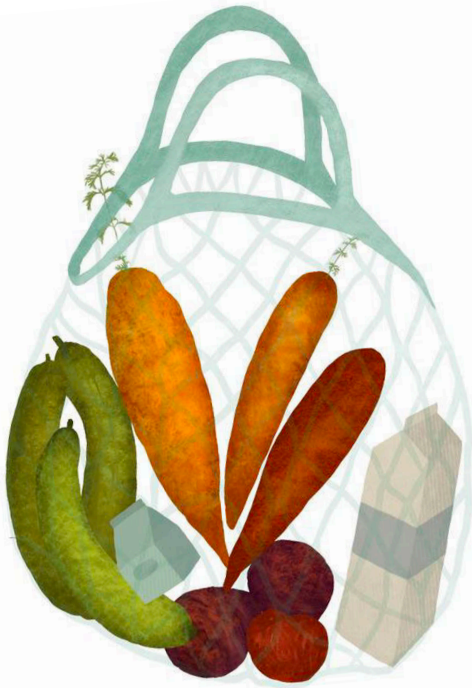
Illustration: Karen Rosenlund

»I Irma er vi stolte af at have varer af god kvalitet på hylderne, og økologiske varer kan have vidt forskellig kvalitet, hvilket også resulterer i forskellige udsalgspriser. Således er den mysli, vi har på hylden, ganske rigtigt prissat højere end de andre i pristjekket; der er tale om en mærkevare, og den er derfor ikke direkte sammenlignelig. Vi er dog i Irma